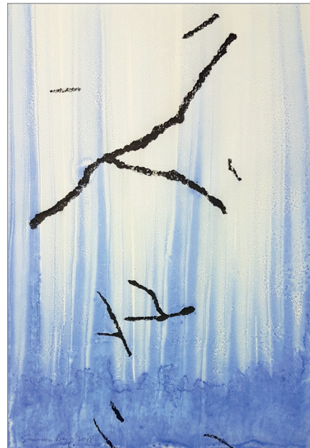
Zweige 20, 2018, Öl und Tusche auf Papier, 35 x 24 cm