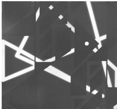
Glasnotation. M. 2016, Glasmalerei, 63 x 68 cm